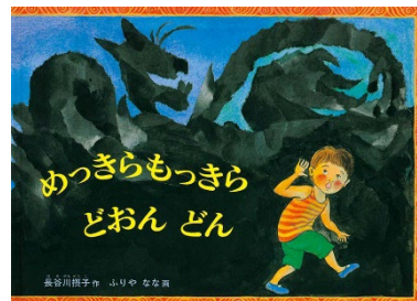
「めっきら もっきら どおん どん」

かんたがお宮にある大きな木の根っこの穴 から落ちて訪れた国は、何ともへんてこな世 界でした。そしてそこのおかしな住人とかんた はすっかり仲良しになり、時のたつのを忘れて 遊び回ります。けれどもすでに夜。遊び疲 れて眠った3人のそばで、心細くなったかん たが「おかあさん」と叫ぶと……躍動すること ばと絵が子どもたちを存分に楽しませてくれ るファンタジーの絵本です。